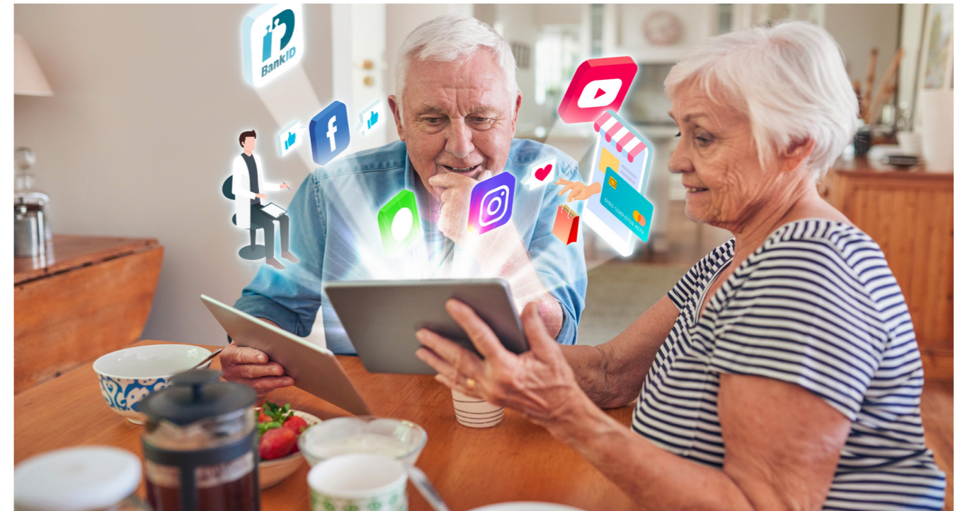
Bild 2: Den digitala kompetensen är allt viktigare även för de äldre men är fortfarande ojämnt fördelad bland dem. Den mest välutvecklade hanteringen finns bland de välutbildade vars värderingar innebär högt ställda krav och förväntningar.

Genom att använda kulturkartan och kombinera den med resultaten från mWVS kan man se hur värderingarna bland migranter från olika länder skiljer sig från värderingarna i Sverige, men även hur de skiljer sig från de värderingar som råder i de länder man kommer ifrån. När de bott i Sverige en tid ändras värderingarna bland migranterna påtagligt när det gäller frihetliga värderingar. Rörelsen från patriarkala värderingar är mycket tydlig. Däremot består de religiösa värderingarna och därmed är av-